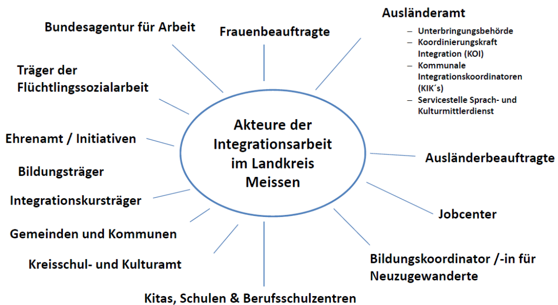
Abbildung 1: Akteure der Integrationsarbeit im Landkreis Meißen

Es existiert bereits ein gut koordiniertes Netzwerk an Akteuren der Integrationsarbeit im Landkreis Meißen. Besonders vor dem Hintergrund der Herausforderungen der Integrationsarbeit im ländlichen Raum, bilden stabile Netzwerkstrukturen eine tragende Rolle. Der folgende Abschnitt unternimmt eine knappe Skizzierung der zentralen Institutionen, Akteure und bereits laufenden Aktivitäten im Bereich Integration im Landkreis Meißen.